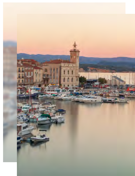
Port-Vieux de la Ciotat à 6 min* en voiture de la résidence

La proximité immédiate des transports en commun et de l'accès à l'autoroute A50 vous permet aussi de rejoindre rapidement le cœur de ville ou les différents bassins d'emploi alentours.