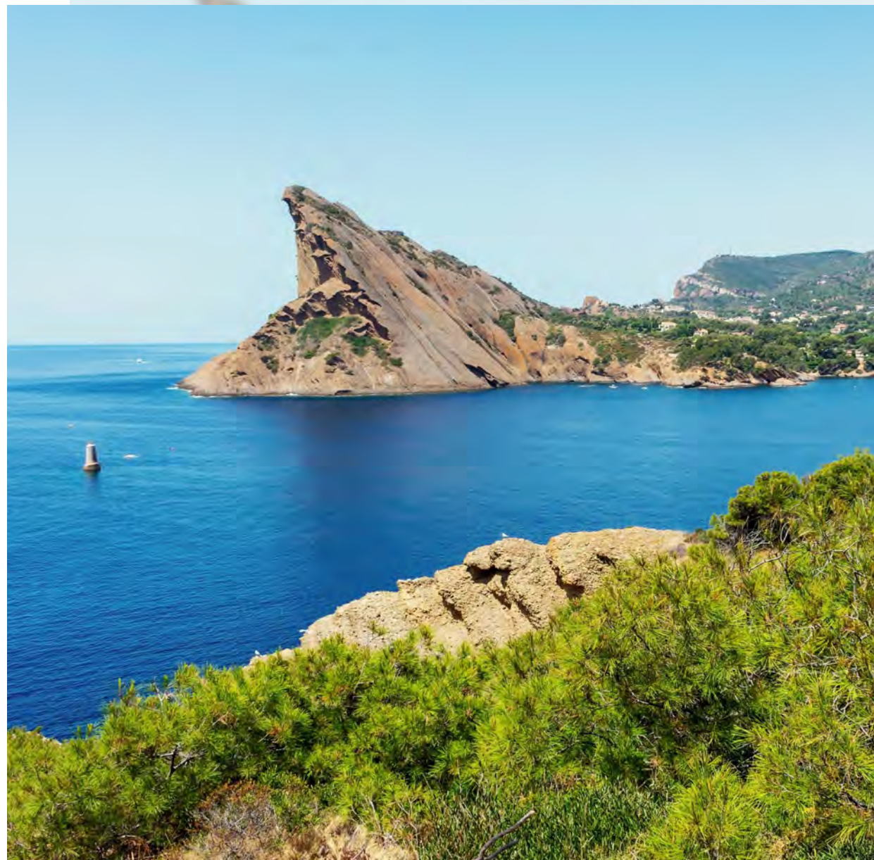
Vue sur le Bec de l'Aigle à 10 min* en voiture de la résidence

Ses magnifiques chemins de randonnée, à l'image de la célèbre Route des Crêtes, permettent de rejoindre Cassis tout en offrant des vues imprenables sur les eaux turquoise et les falaises à pic.