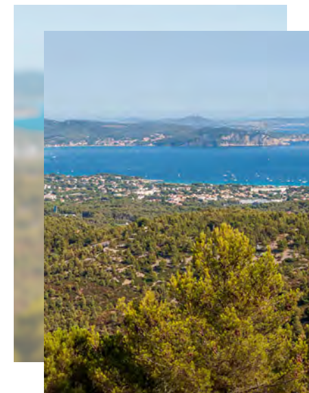
Vue sur la baie de La Ciotat